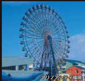
マリノアシティ福岡