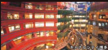
キャナルシティ博多